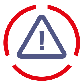
1. RISICOBEBEERSING focus op voorkant veiligheidsketen