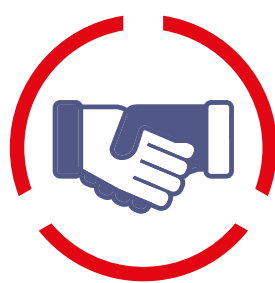
3. SAMENWERKEN op juiste schaal en in juiste netwerken