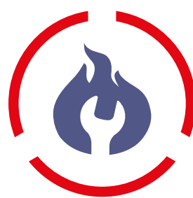
4. VAKMANSCHAP professioneel en resultaatgericht