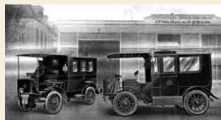
Een vroeg staaltje van multidisciplinaire samenwerking: de Ambulancedienst van de Geneeskundige Dienst schakelde in 1908 over van rijwielbrancards op elektrische ambulances dankzij de samenwerking met de technuten van de brandweer.