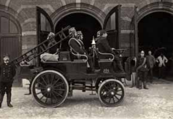
Het allereerste paardloze voertuig van de Amsterdamse brandweer werd in 1902 als eerste-uitrukeenheden in dienst gesteld. Met vijf man, redgereedschap en de mogelijkheid van de waterleiding af te leggen was dit een publiekstrekker van de bovenste plank.