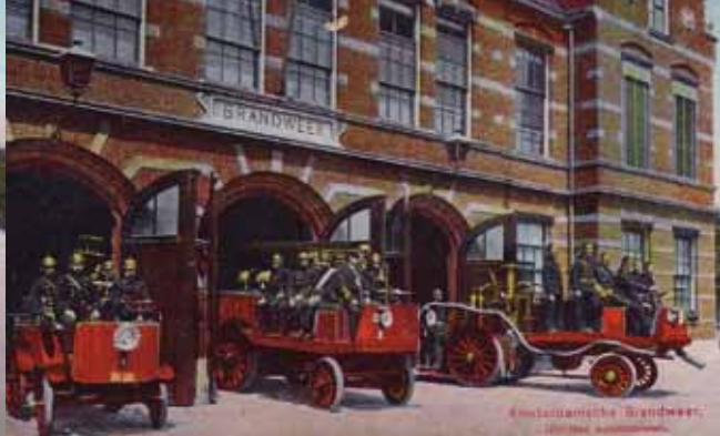
Binnen tien jaar na de opening van de kazerne 'D' aan de Hont-horststraat in 1897 was het aanzien van de kazerne en de brandweer compleet veranderd door de automobilisering.