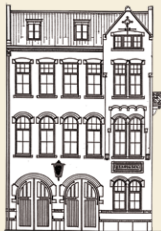
De kazerne 'V' aan de Dapperstraat was al in 1912 de eerste brandweerkazerne zonder stallen. In 1924 werden de laatste paarden bij de Amsterdamse brandweer afgeschaft.

Net als de taxi's in Amsterdam kort daarvoor ging de brandweer vanaf 1904 over op paardloze voertuigen. Zelfs de ambulancedienst volgde al in 1908. Het beeld van de straat werd onomkeerbaar anders. 'Vooruitgang' heet dat.