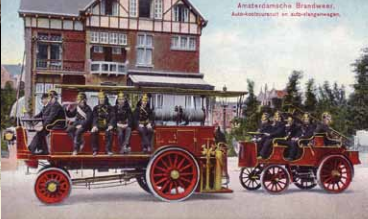
Na korte tijd bleek het mogelijk om grotere paardloze karren in te zetten. Daarmee werd een watertank en een complete bezetting vervoerd. Dit soort voertuigen heeft in Amsterdam dertig jaar dienst gedaan in vooral de oude kern.