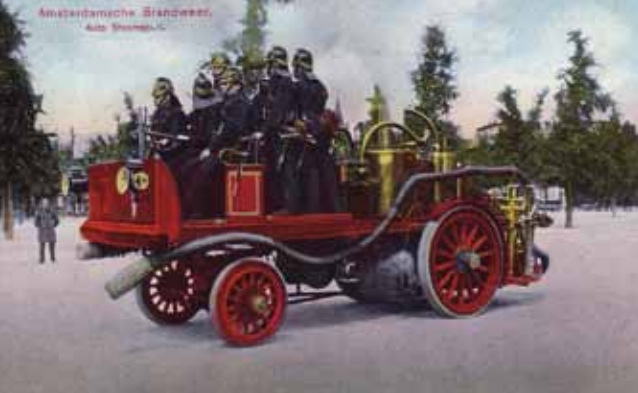
Bij stoomspuiten werd de kracht van de stoommachine ook ingezet om het voertuig zelf voort te bewegen. Dat ging misschien niet snel, maar spaarde wel dure paarden en koetsiers uit.