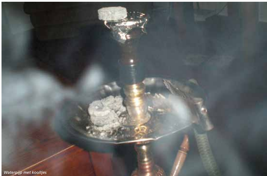
Waterpijp met kooltjes