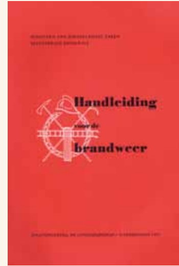
1957 Handleiding van de Brandweer Vanaf 1955 kwamen er in Nederland rijksexamens, waarvoor de les- en leerstof te vinden was in het bij de ouderen beruchte 'rode boek', de Handleiding voor de Brandweer.