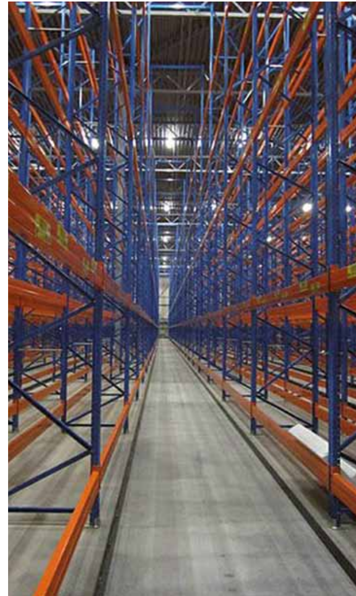
Deze magazijnstellingen worden gebruikt voor het opslaan van cacao-poeder. Tussen deze stellingen rijdt een volautomatische vorkheftruck. Deze warehouse wordt permanent onder 17% zuurstofreductie gehouden en bij een brand terug gebracht naar 12%.

dienstverlener DSV liet daarom een revolutionair preventiesysteem testen voor een nieuwe cacao-loods (waar meer dan 1 miljoen kilo cacao kan worden opgeslagen) aan de Durbanweg in Amsterdam. Met een verrassend simpel principe: zuurstofreductie, want zonder voldoende zuurstof geen brand. De Wit legt uit: 'Normaal gesproken is het zuurstofpercentage in de lucht zo'n 21%. Als je dat terugbrengt naar 17% kan in principe niks ontsteken. De kans op het ontstaan van brand is dus minimaal. In de opslagruimte voor cacao wordt daarom het zuurstofpercentage continu op 17% gehouden. Het systeem heeft dus een preventieve werking. 'Dit reduceren van het zuurstofgehalte gebeurt met behulp van een stikstofgenerator. Die maakt van buitenlucht geconcentreerde stikstof en blaast dat naar binnen. Daardoor stijgt het stikstofpercentage en daalt het zuurstofpercentage in de gasdichte loods. Een nadeel: voor mensen is een ruimte met een zuur-