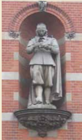
Van de stamvader van de brandweer Jan van der Heijden staat een beeld in de gevel van het Stedelijk Museum. In zijn handen heeft hij een model van een handbrandspuit.