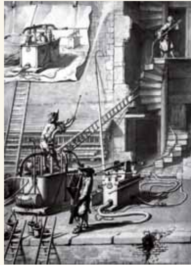
1690 Jan van der Heijdenboek Het eerste brandweerboek ter wereld, van de hand van Jan van der Heijden, bevatte een uitgebreide beschrijving van de technieken en tactieken om een brand snel en effectief te blussen.