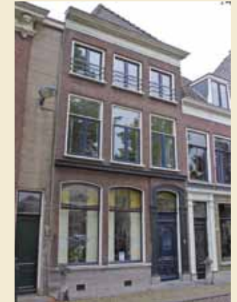
Recent onderzoek bracht aan het licht dat Jan van der Heijdens geboortehuis in Gorinchem waarschijnlijk op deze plaats aan Het Eind heeft gestaan en niet - zoals lang vermoed - in de Gasthuisstraat.