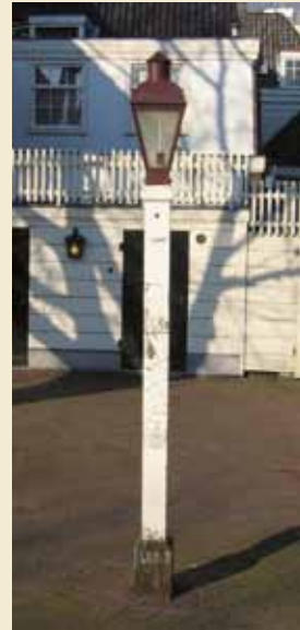
Op een paar plaatsen - zoals op het Amstelveld - staan nog lantaarnpalen van het model dat Jan van der Heijden introduceerde en waarmee hij eigenlijk het beroemde Amsterdamse nachtleven mogelijk maakte.