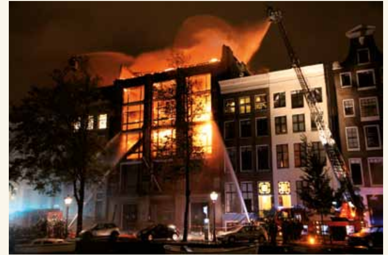
2011 Brand Keizersgracht De brand op de Keizersgracht eerder dit jaar, woedde vlakbij de plek waar Jan van der Heijden ooit woonde en werd eigenlijk nog steeds op dezelfde manier geblust als hij zou hebben gedaan. Alleen de spullen zijn beter en de brandweertactieken veel professioneler.