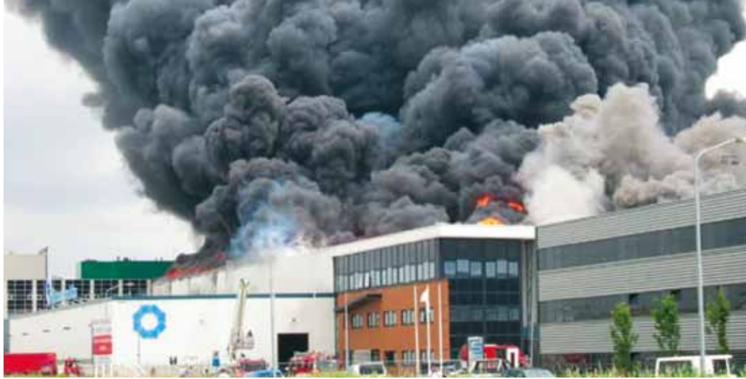
Cacaobrand in Wormer