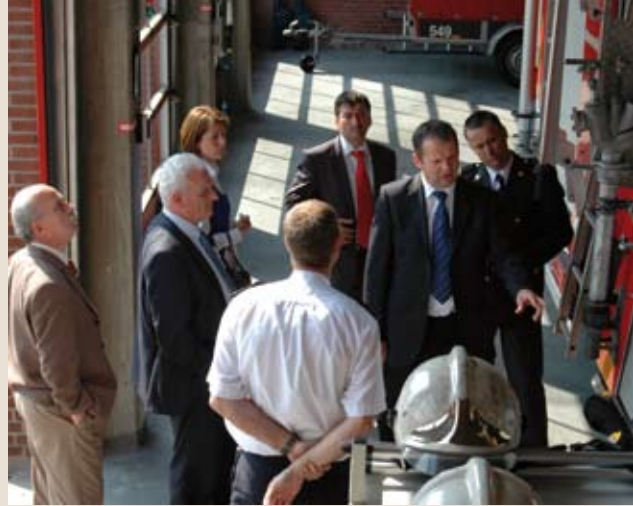
De Turkse delegatie op bezoek bij kazerne Diemen

Voor de kennisuitwisseling rondom duiken wordt deze zomer een bezoek gebracht aan het Turkse korps. Duikspecialisten uit Amsterdam-Amstelland en Utrecht brengen dan een bezoek aan Kocaeli. Tijdens dit bezoek maken zij eerste inventarisatie van