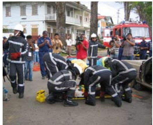
Veel media aanwezig bij demonstratie op Nassylaan in Paramaribo