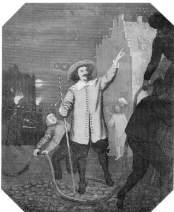
Ook de eerste commandant over de gehele brandweer in Amsterdam, Jan van der Heiden, bediende zich van een staf om zijn functie kenbaar te maken.

en het exemplaar van de commandant werd daarmee de commandostaf. Met de opkomst van de brandweeruniformen begin vorige eeuw, kon men daaraan zien wie de baas was en kreeg de staf vooral een ceremoniële functie.