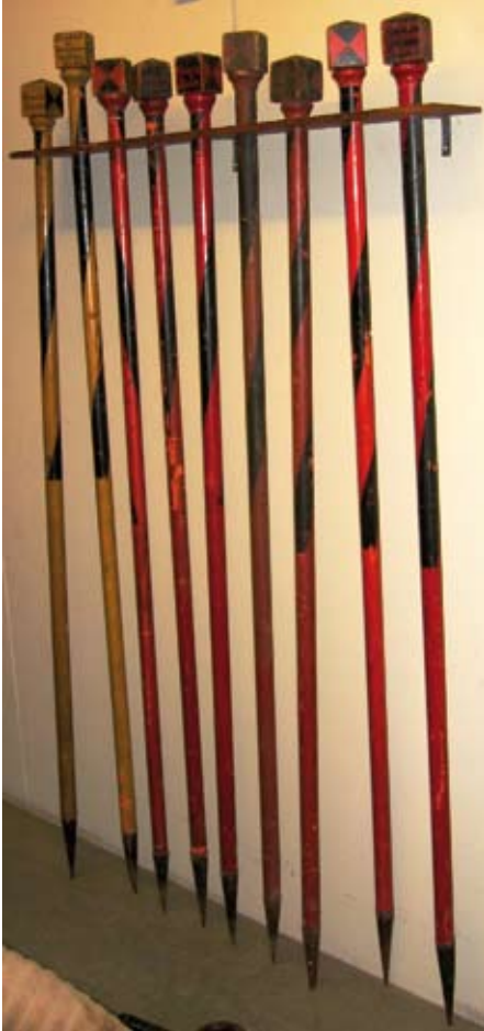
In alle brandweermusea zijn prachtige verzamelingen brandweerstaffen te bewonderen, zoals hier in Hellevoetsluis.