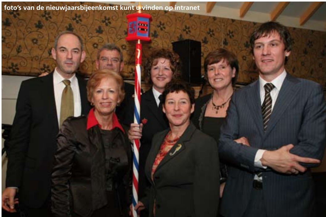
De burgemeesters van alle regiogemeenten met de staf van Brandweer Amsterdam-Amstelland

foto's van de nieuwjaarsbijeenkomst kunt u vinden op intranet