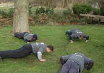
Outdoor 3: Niet elke opdracht gaat in één keer goed. Het is een groepsproces, dus een individuele misser betekent opdrukken voor iedereen.