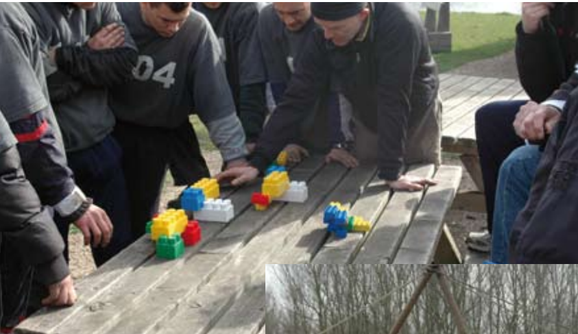
Outdoor 4: Het resultaat van de communicatie-opdracht wordt besproken.