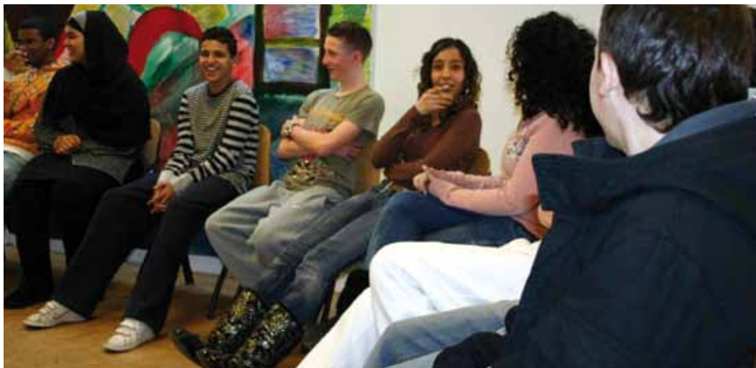
Scholieren van het Sweelinck College