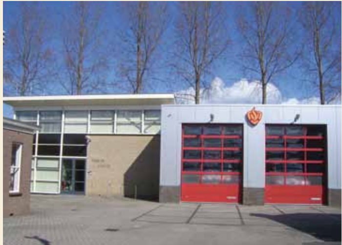
De huidige behuizing van het korps is vrijwel geheel met eigen handen tot stand gebracht. Menig korps is er jaloers op en de Driemonders zijn terecht trots op hun korps.

Per 1 augustus 1966 werd de gemeente Weesperkarspel opgeheven en opgesplitst. De oostelijke helft ging over naar Weesp en de westelijke helft naar Amsterdam, dat daar de nieuwe stadswijk Bijlmermeer ging bouwen. Het brandweerkorps werd daarmee onderdeel van de Amsterdamse brandweer, waarmee snel goede banden werden opgebouwd. Van de Amsterdamse faciliteiten maakten de Driemonders goed gebruik en in de afgelopen jaren liften men goed en graag mee met het grote korps. Gaandeweg werden uitrusting en opleiding verbeterd en in 1977, 1988 en 2004 werd de autospuiter vernieuwd. Ook het