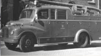
Een onverwoestbare autospuit was de Austin uit 1955, die gemakkelijk 22 jaar meeging en een beetje vreemde eend in de bijt bij de Amsterdamse brandweer werd.