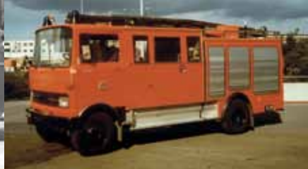
Voor het Driemondse spuihuis was alleen het kleine binnenstadstype van de Amsterdamse brandweer geschikt en in 1977 werd er zo één in Driemond geplaatst.