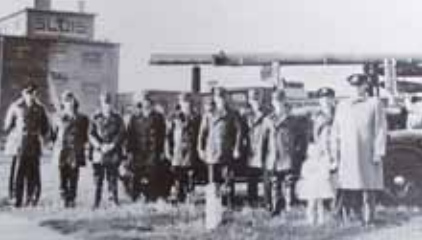
De eerste automobiel-brandspuit van Weesperkarspel was een Ford V8 en het voltallige korps bestond in de jaren veertig uit tien brandweerslieden.