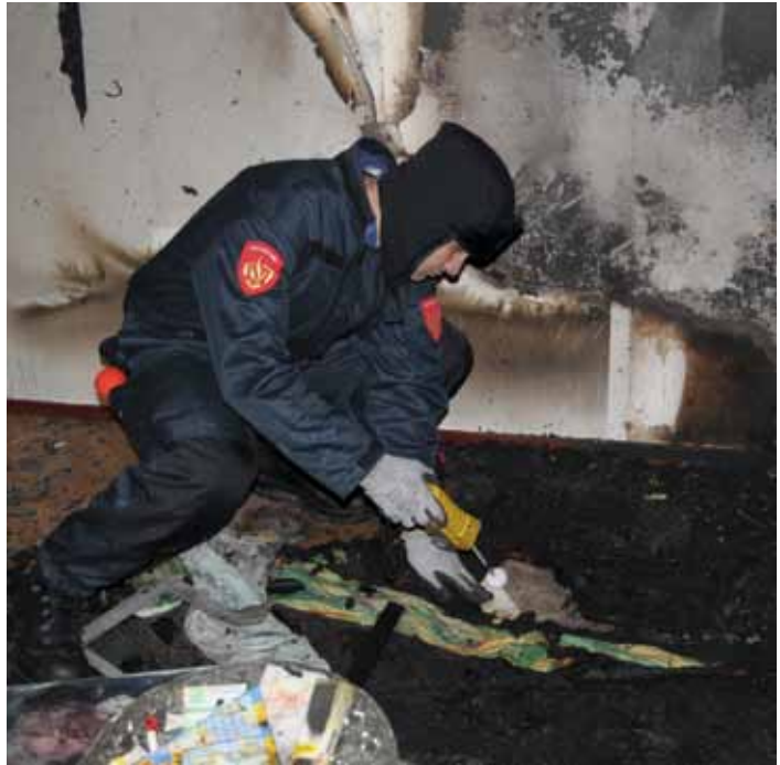
Team Brandonderzoek in actie

Het grootste deel van de woningbranden ontstaat buiten kantooruren. Dus 's avonds, 's nachts of in het weekend. 'Dat zijn tijdstippen waarop mensen over het algemeen thuis zijn. Zo'n twintig procent van de branden vond echt 's nacht plaats, na 0.00 uur. In de meeste