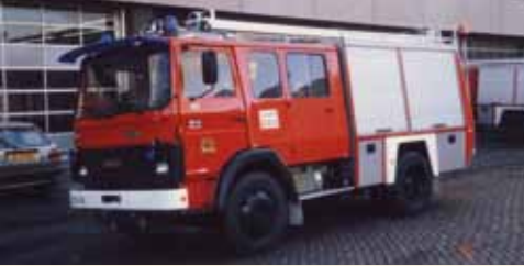
In 1988 kreeg het korps het standaardtype tankautospuiter dat in heel Amsterdam (en Diemen) werd ingevoerd. Na de buitendienststelling heeft het voertuig nog jaren kunnen werken in Zaanstad.