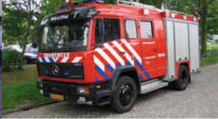
In 2004 kreeg het korps één van de twee prototypes van de nieuwste generatie tankautospuiter voor Amsterdam. Door het faillissement van de opbouwfabrikant bleef het bij die twee exemplaren.