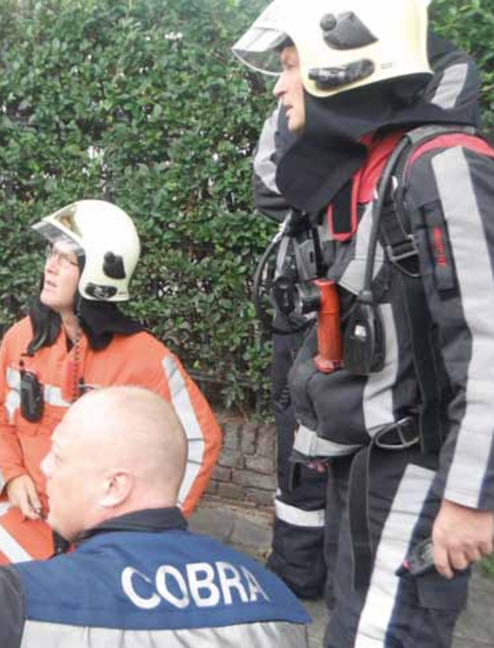
een grote brand in Koog al d Zaan, 16 september 2011

aan de Amstel is een rustige kazerne. Maar nu hebben we in een periode van vijf maanden alleen al voor de Cobra 44 uitrukken gehad. En vergis je niet, dit ging dag en nacht door. We gingen met alle uitrukken mee en vier van de tien keer hebben we de Cobra kunnen inzetten. Verder hebben we nog, samen met het NIFV, een week proef gedraaid onder andere in de flashover container. Daarin deden we vergelijkbare proeven met zowel de Cobra als met de huidige blus-technieken. De resultaten zijn verbluffend. Uit alle tests blijkt dat je met de inzet van Cobra het gevaar van een flashover of backdraft kunt bezweren. Ik ben ervan overtuigd dat een Cobrasysteem een waardevol stuk gereedschap is naast onze huidige blusmiddelen. Het verhoogt absoluut de veiligheid van de manschappen.'